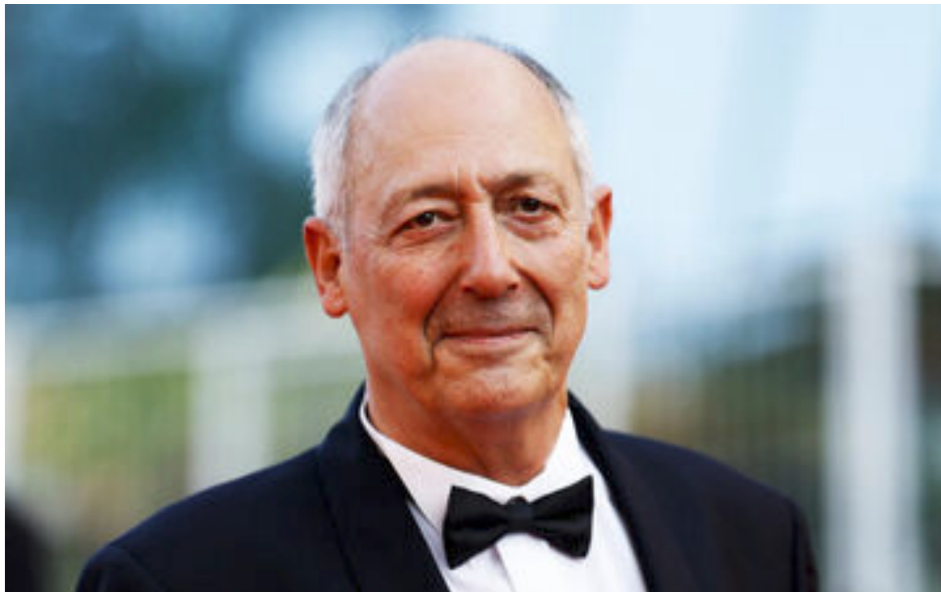
Sam Karmann, acteur et réalisateur : « Le handicap n'empêche pas le talent » P