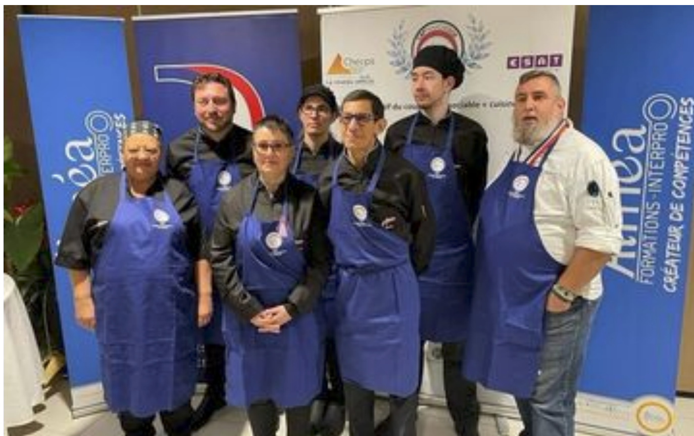
Cap'HandiCook, le concours façon « Top chef » pour personnes handicapées qui mêle cuisine et plaisir P